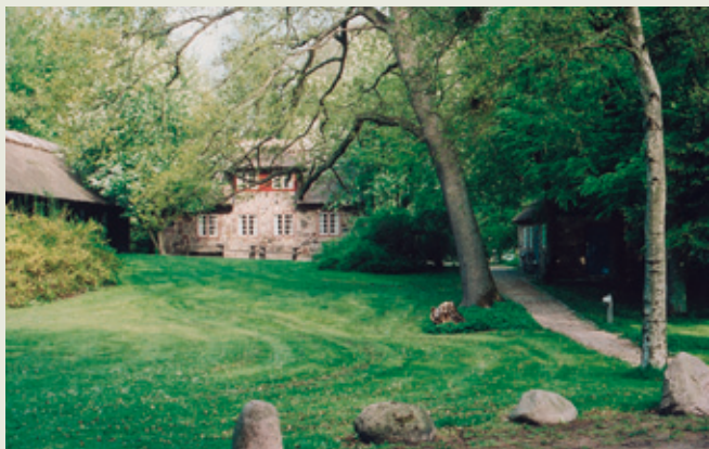
Den gamle og den "nye" Søgård.