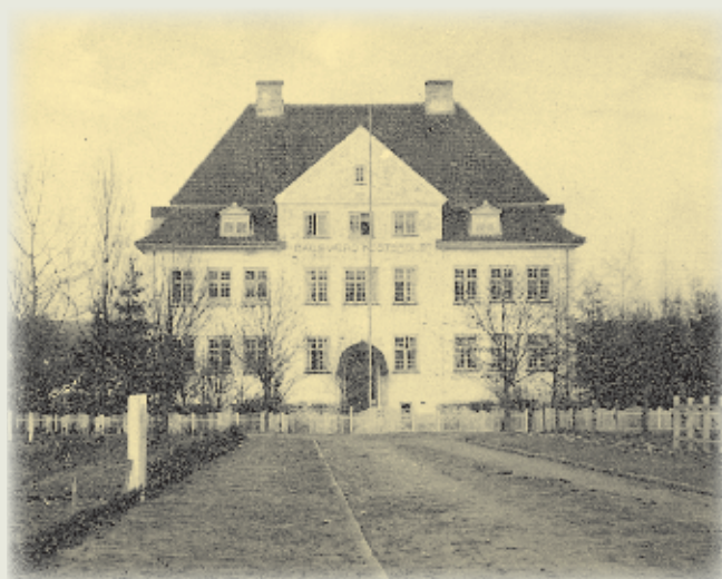
... og ca. 1915, hvor de omliggende arealer var fuldstændig ubebyggede.