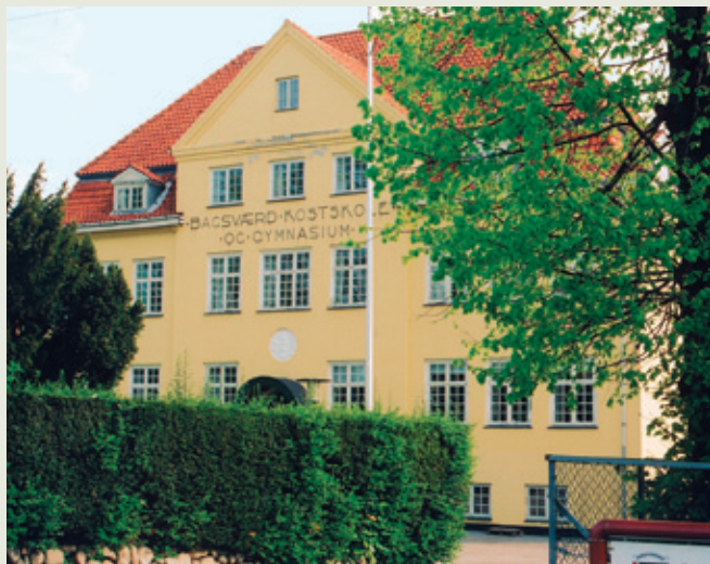
Hovedbygningen i dag.

Den nye kostskole fik hurtigt flere elever, og man byggede løbende til ind- og udvendigt. I 1960'erne havde skolen nået et elevtal i omegnen af de 800 og dette niveau holdes den dag i dag. Bagsværd Kostskole breder sig over et stort område og råder over mange forskellige bygninger bl.a.: Bakkehuset, Stenhuset, Casa Nova, Haraldsgave, Birkehuset og andre ejendomme. Fortsæt ad Aldershvilevej og se flere af kostskolens bygninger.