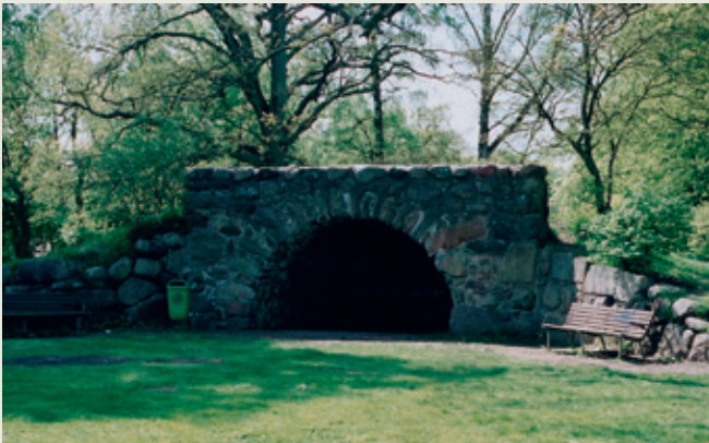
Grotten ligger under en kunstig bakke og har også været brugt som iskelder.

10. Det er muligvis også Holmskjold, der lod parkens kunstige grotter anlægge efter engelsk forbillede. Der findes både den på kortet markerede grotte, men også én, hvis man i stedet går ad stien langs søen i retning mod rostadion. På stien mod rostadion finder man desuden en lille romersk pavillon, men hvornår den stammer fra er svært at sige med sikkerhed.