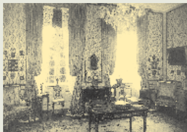
Interiører fra slottet. Grevindens soveværelse samt to af stuerne. Fotos fra 1902.