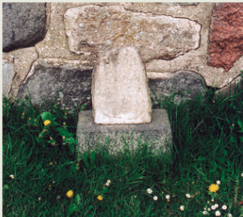
Grevindens ydmyge gravsten.

7. Angelica blev begravet på Frederiksberg Kirkegård. I 1984 så en herre gravstedet, og mente, der måtte gøres noget ved den forsømte sten. Den endte hos formanden for Gladsaxe Miljøforening, A. Hermann, som tog affære. Stenen blev renoveret, men da en slægtning til grevinden i mellemtiden døde, og hans sten skulle stå på familiegravstedet på Frederiksberg, var der ikke længere plads til grevindens sten. Efter megen turbulens, fik Miljøforeningen endelig i 1989 tilladelse til at stille den i Aldershvileparken, hvor den nu står ved ruinen i hjørnet ved sydmuren.