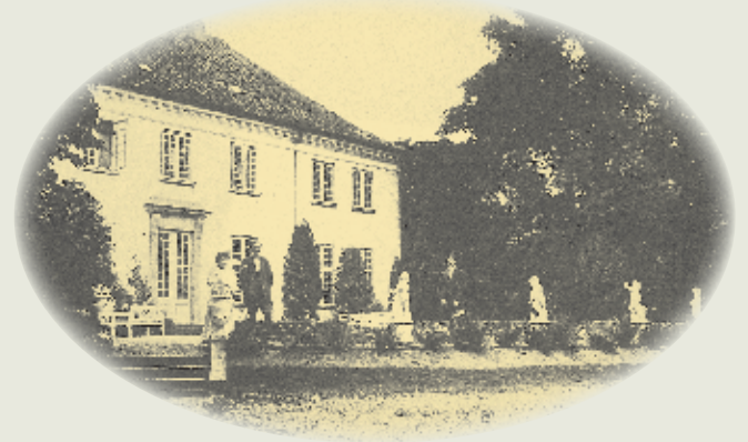
Hovedbygningen set fra den kunstige sø med de marmorputti, som grevinden solgte efter branden.

11. I 1897 var parken groet godt til, og da direktøren for gammel og ny Carlsberg, Anton van der Kühle, købte slottet, lod han hovedbygningen restaurere. Den kanal, der løb bag slottet, lod han udvide til en egentlig sø.