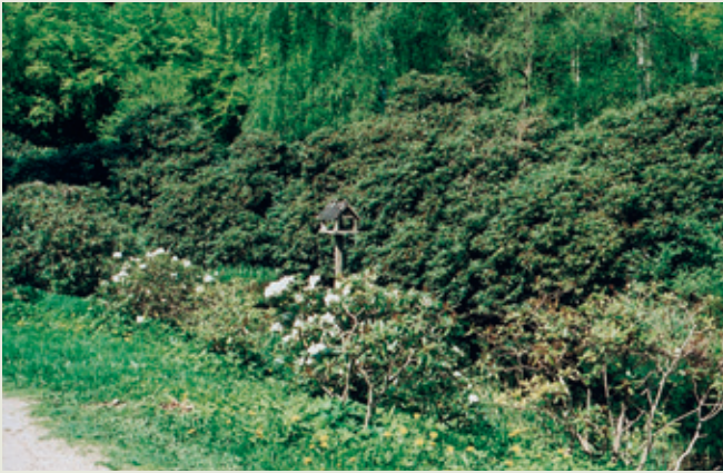
Går man fra ruinen i retning mod Slotspavillonen ad den grusede sti, ser man på sin højre hånd de sidste rester af Holmskjolds rhododendronbede.

10. Det er muligvis også Holmskjold, der lod parkens kunstige grotter anlægge efter engelsk forbillede. Der findes både den på kortet markerede grotte, men også én, hvis man i stedet går ad stien langs søen i retning mod rostadion. På stien mod rostadion finder man desuden en lille romersk pavillon, men hvornår den stammer fra er svært at sige med sikkerhed.