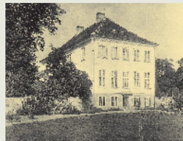
Aldershvile Slot fra to vinkler i 1902.