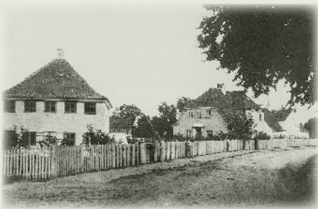
Aldershvilevej 126-130 ca. 1920. Selve vejen ser mere civiliseret ud i dag, men husene er de samme og let genkendelige.